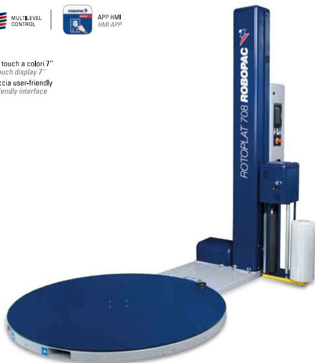
LAYOUT ROTOPLAT 708 PVS [mm]