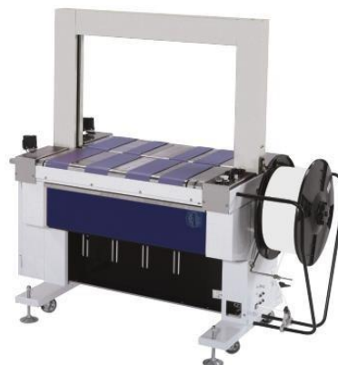
SM 601 B